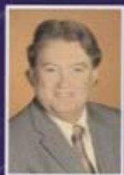
Par Jacques Martel